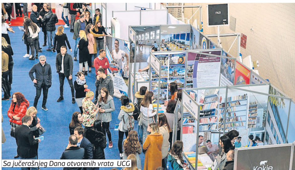
Sa jučerašnjeg Dana otvorenih vrata UCG

Rektor Univerziteta Crne Gore (UCG) Danilo Nikolić je, na jučerašnjem otvaranju Dana otvorenih vrata UCG, poželio dobrodošlicu za više od 3.000 maturanata koji su došli iz svih krajeva Crne Gore da se upoznaju sa najstarijom i najvećom institucijom visokog obrazovanja u Crnoj Gori.